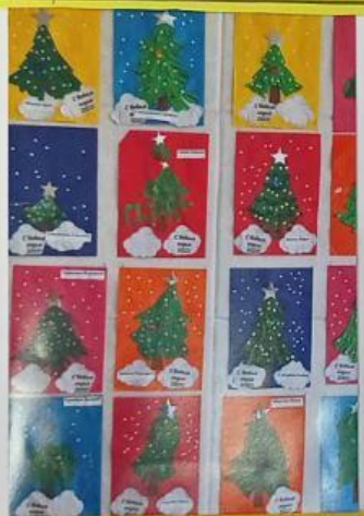
Мы рисуем и читаем, а вы нам помогите и поможете.