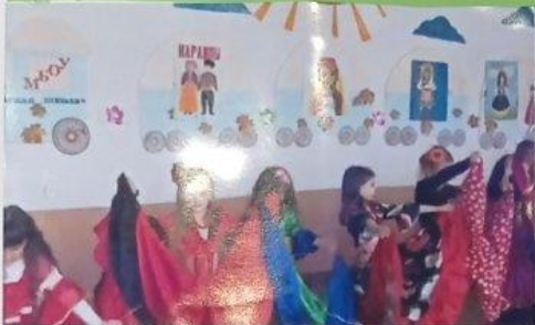
Всем класс подготовили выставку на тему: "Матері"