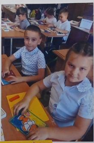
Все мы дружимся с вами, а кто Огдешко забывает!