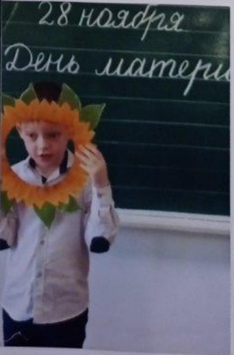
В классе так заведено: "Все мы вместе заодно!"