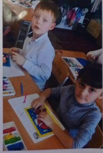
Во время обучения в 1 классе мы изучали много нового. Мы научились читать, писать, считать и играть интересно вместе.