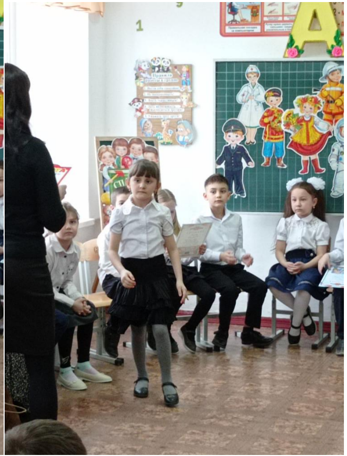
Награждение грамотой «Азбуку прочёл!»