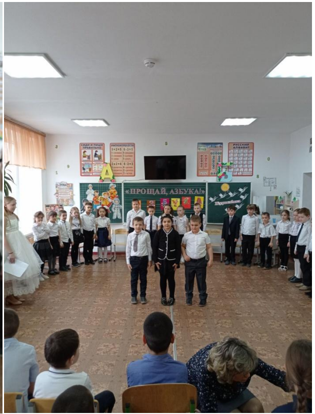
«Азбука в гостях...»