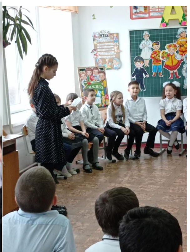
«Баба Яга и её внучка Злочка...»