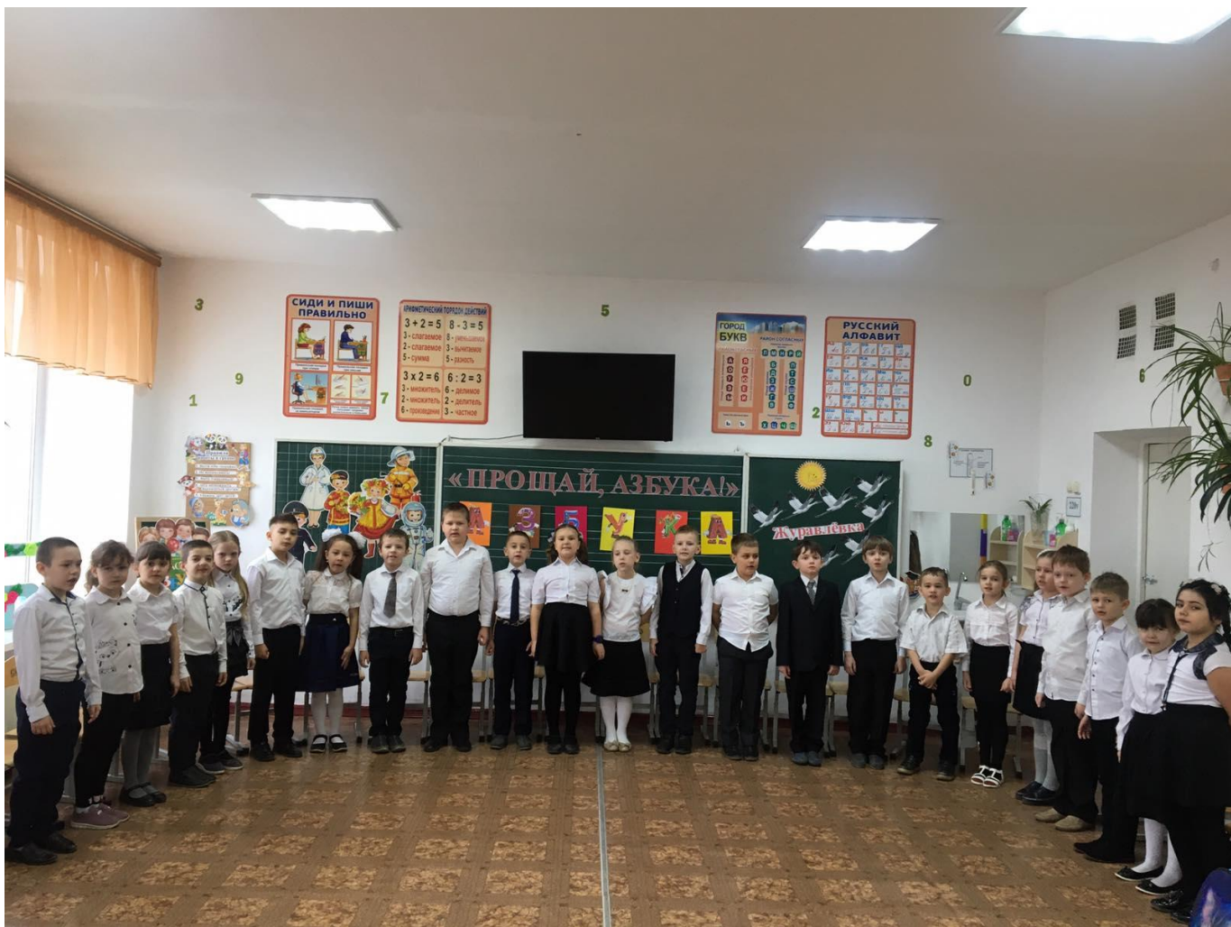
Готовы к празднику «Прощай, азбука!»