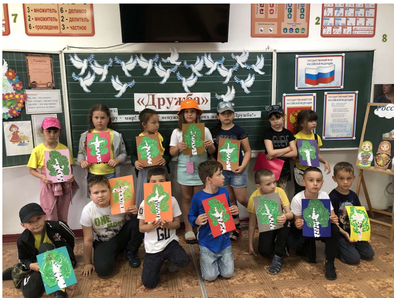
Рваная аппликация «Русская берёза!»