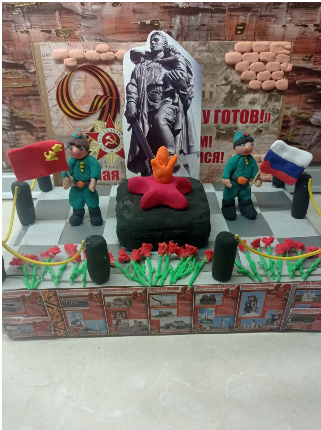
«Памятник советскому солдату» Полянчев Глеб