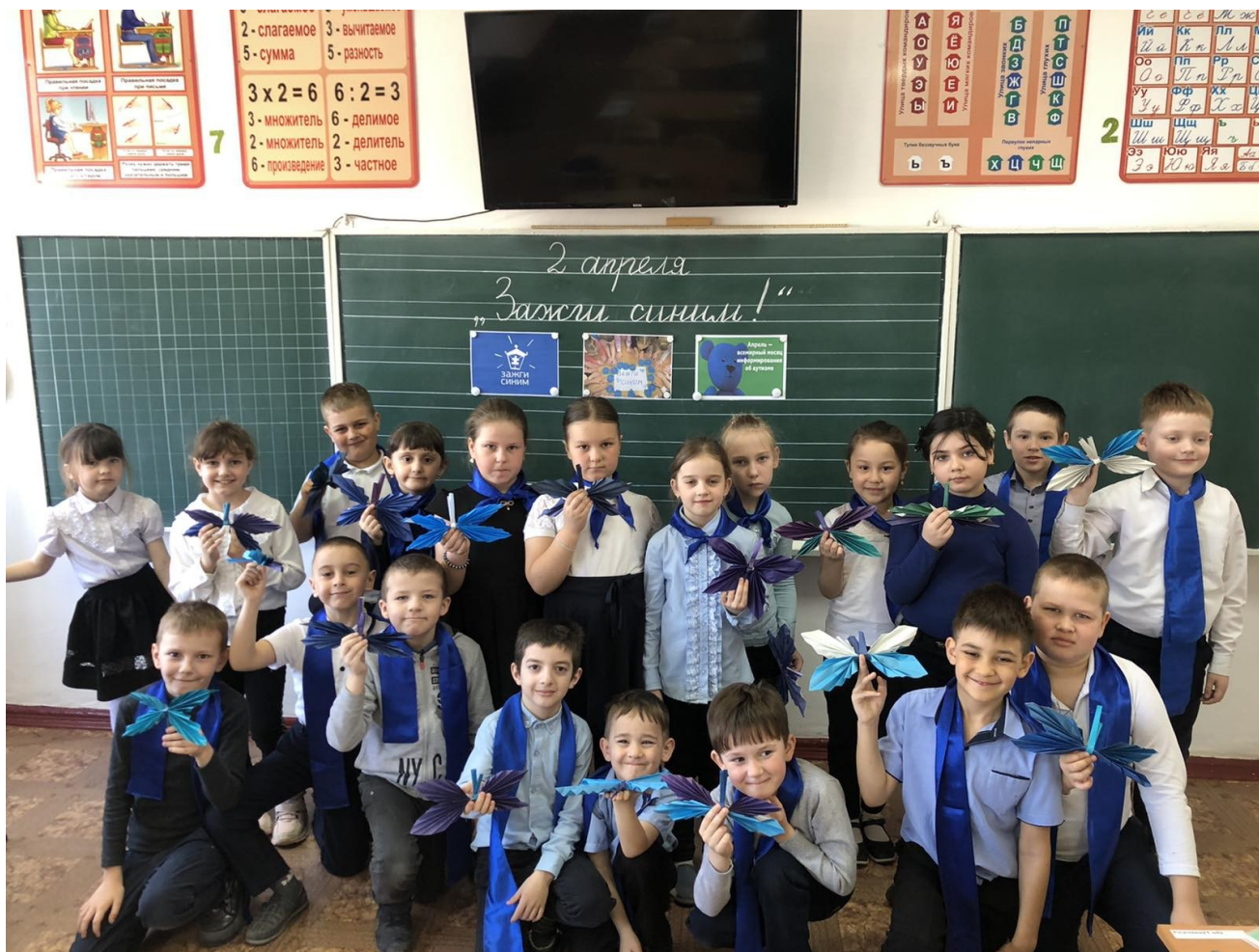
Изготовили бабочек для акции «Зажги синим!»