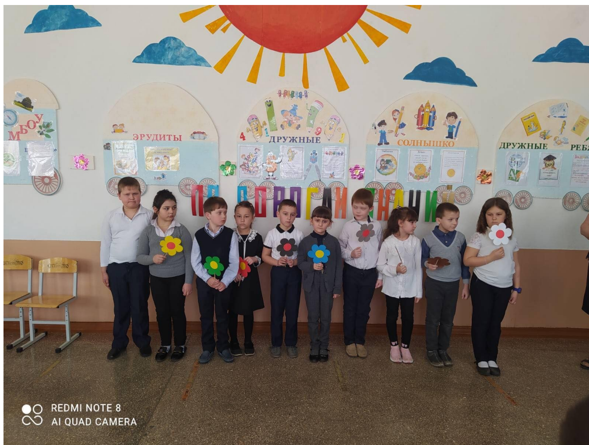
Подготовили обзорную экскурсию о красках.