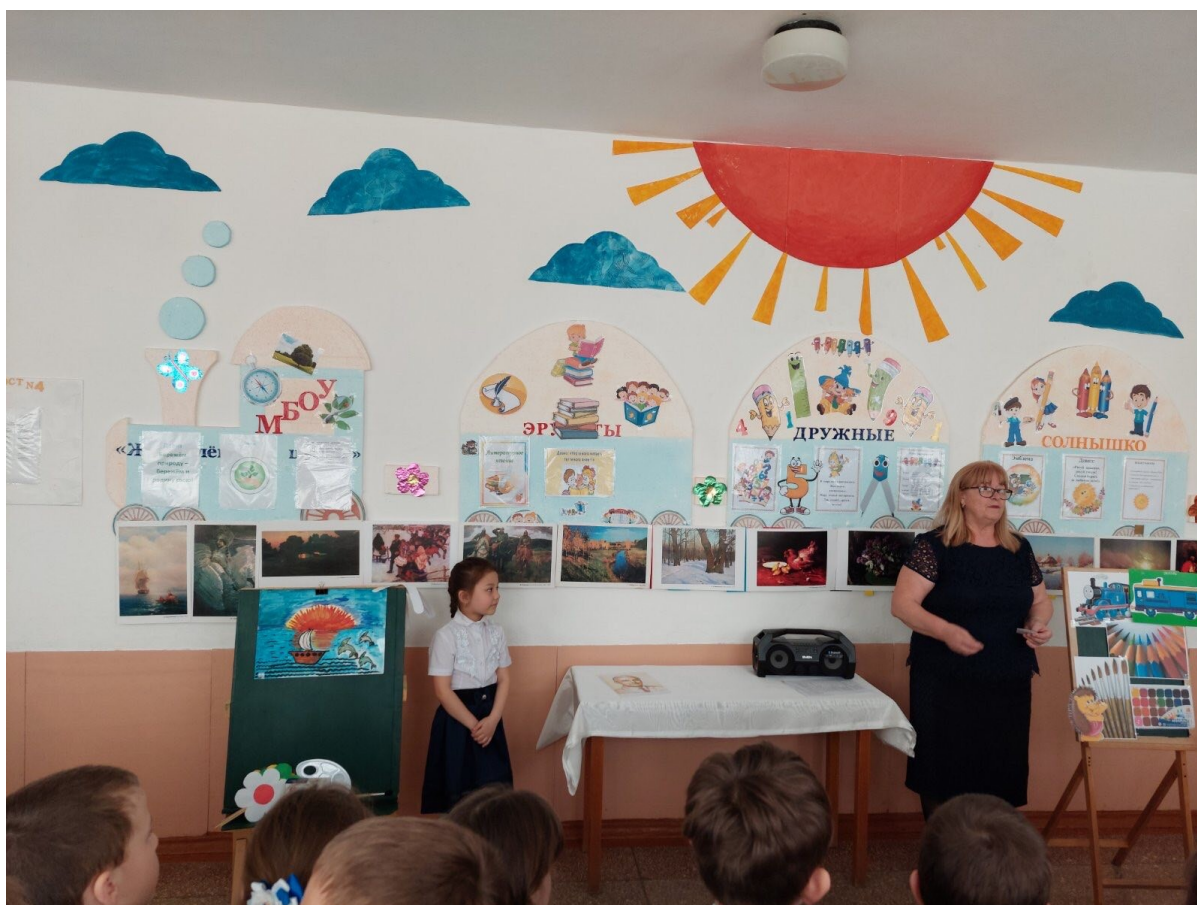
Провели праздник «Лето на полотнах художников!»