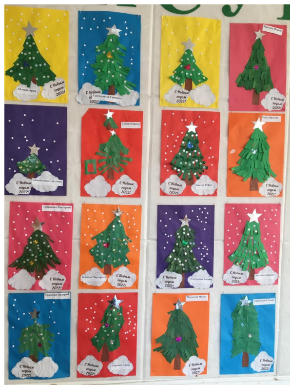
«Новогодняя открытка для родителей!»