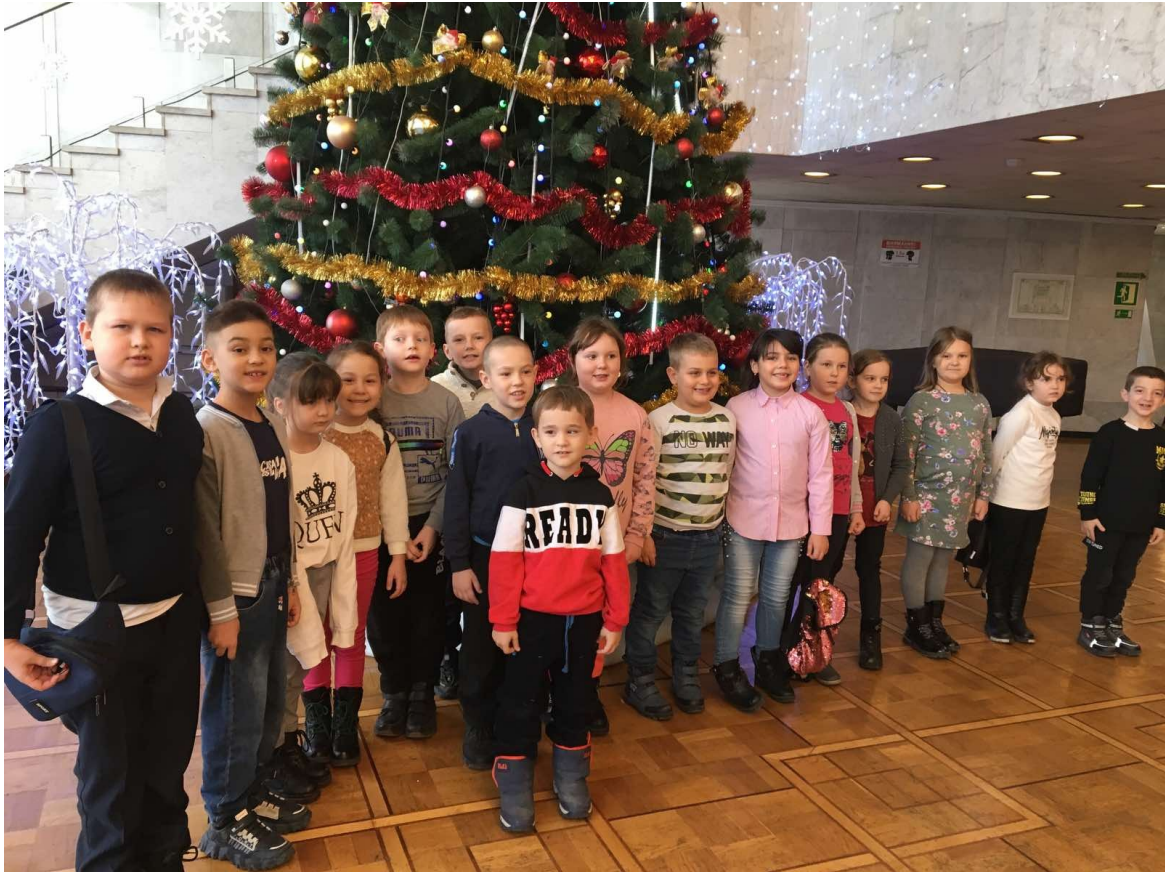
Мы в театре на спектакле «Царевна Лягушка».