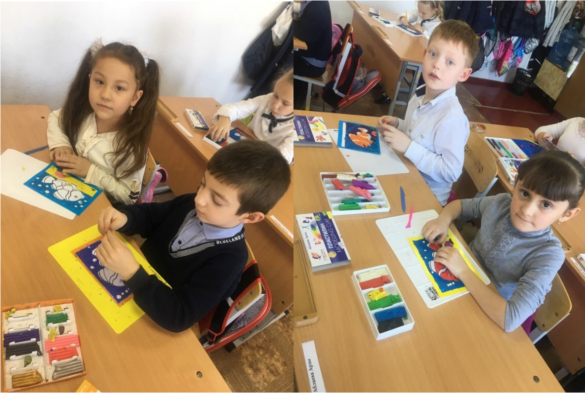
Рисуем пластилином «Рыбка для мамы»