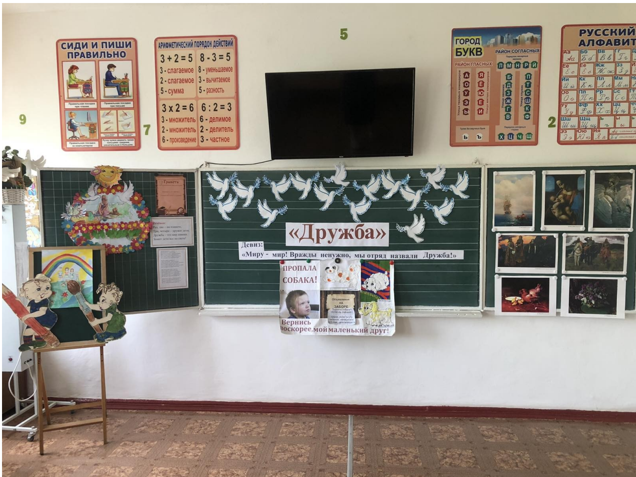
Проект «Пропала собака!»