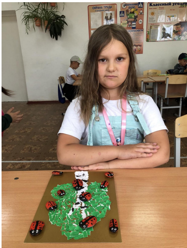
Рисуем на камне «Божья коровка»