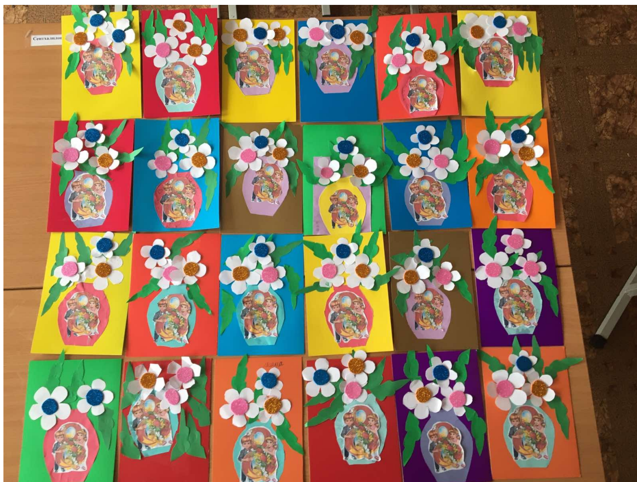
Изготовили открытку для мамы.