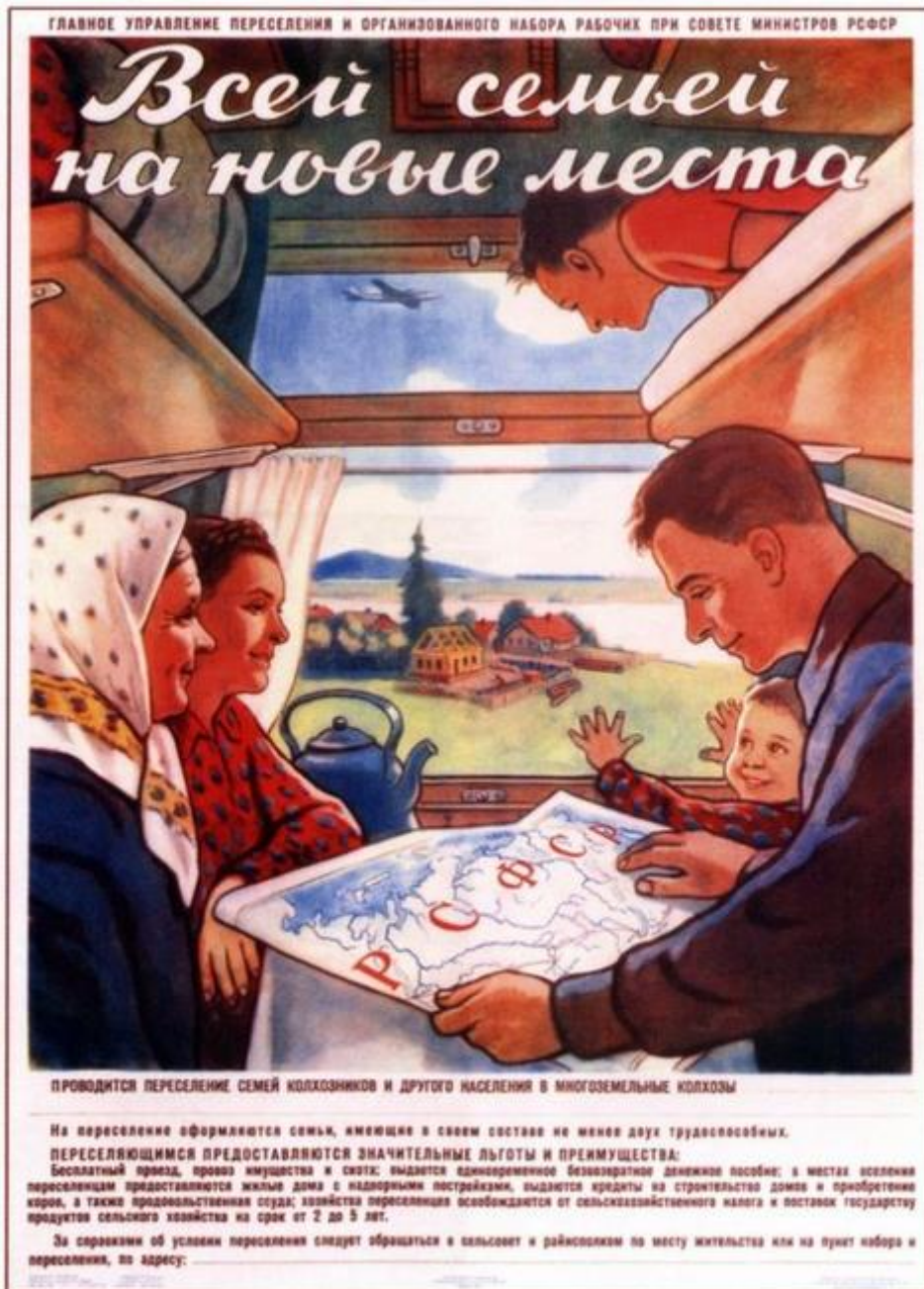
364. Говорков В. Всей семьей на новые места. 1957